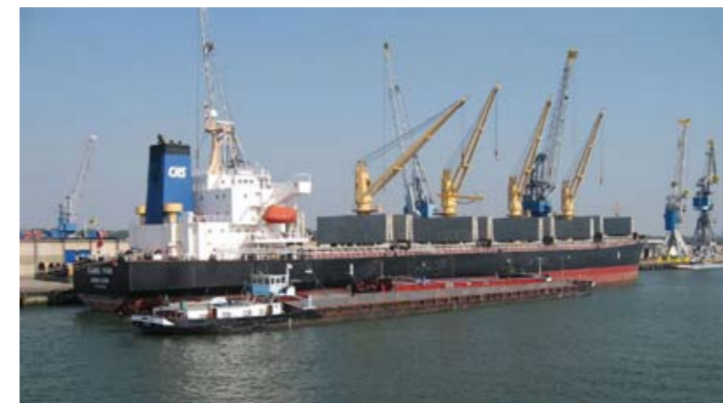
Die Werbetrommel rühren: Der RPPC macht den Rotterdamer Hafen internationale bekannt.