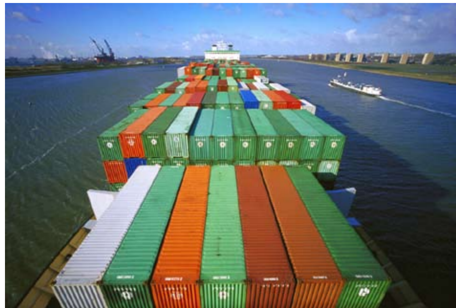
Für viele Überseereedereien ist Rotterdam der erste Hafen, den sie anlaufen.

Kohle und Eisenerz, 20 Prozent Container und fünf Prozent verschiedene Produkte wie Früchte. Doch was nützt ein guter Standort, wenn sich keiner darum kümmert, dass er das auch bleibt? Rotterdam fährt in diesem Bereich gleich zweigleisig.