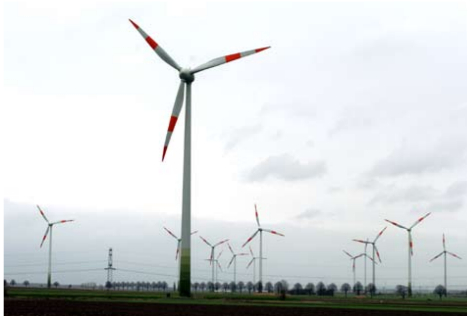
Essent gewinnt Wind in deutschen Windparks